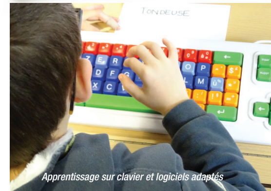
Apprentissage sur clavier et logiciels adaptés