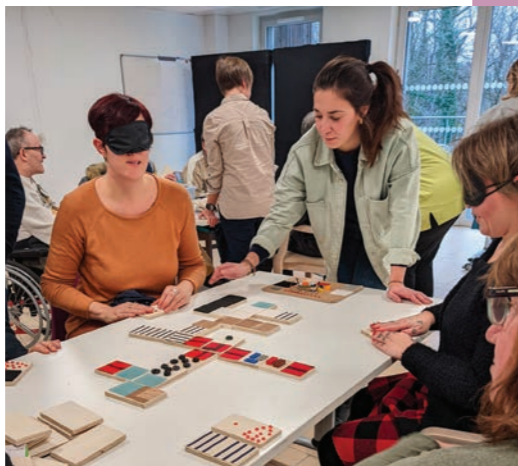
Découverte du jeu Tactylo'mas

Pour de nombreuses personnes, concernées par un handicap très grave, qu'il soit de naissance (polyhandicap par exemple), acquis (état de conscience altérée, état pauci-relationnel...) ou évolutif dans le cadre d'une maladie très invalidante (maladie de Charcot, myopathies...), l'épanouissement personnel ne passe pas par une insertion professionnelle mais par d'autres expressions personnelles ou participations sociales. C'est la mission de LADAPT de permettre à ces personnes de s'auto réaliser afin qu'elles s'accomplissent et prennent pleinement leur place en tant que citoyennes.